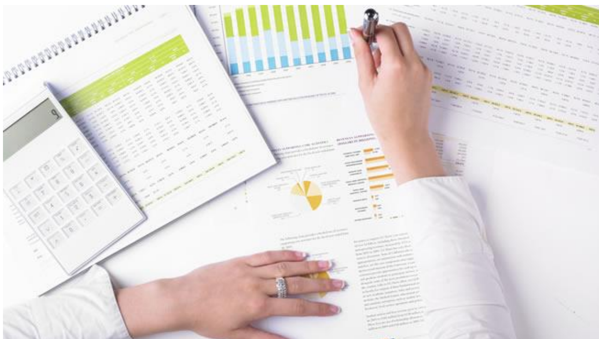
Figura 6: Estados Financieros

En la imagen podemos observar los diferentes datos, técnicas, gráficos y herramientas que utilizan las empresas para crear, e ilustrar sus estados financieros. (Kenel, 2019)