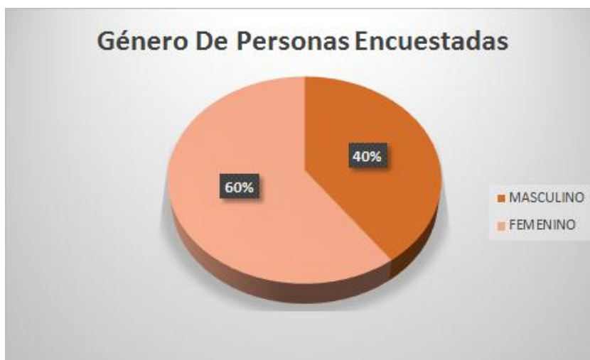
Figura 1. Género de las personas encuestadas

Interpretación: El 60% de las personas encuestadas, tienen de 29 a 39 años y el 96% de las personas encuestadas tienen hasta 50 años de edad.