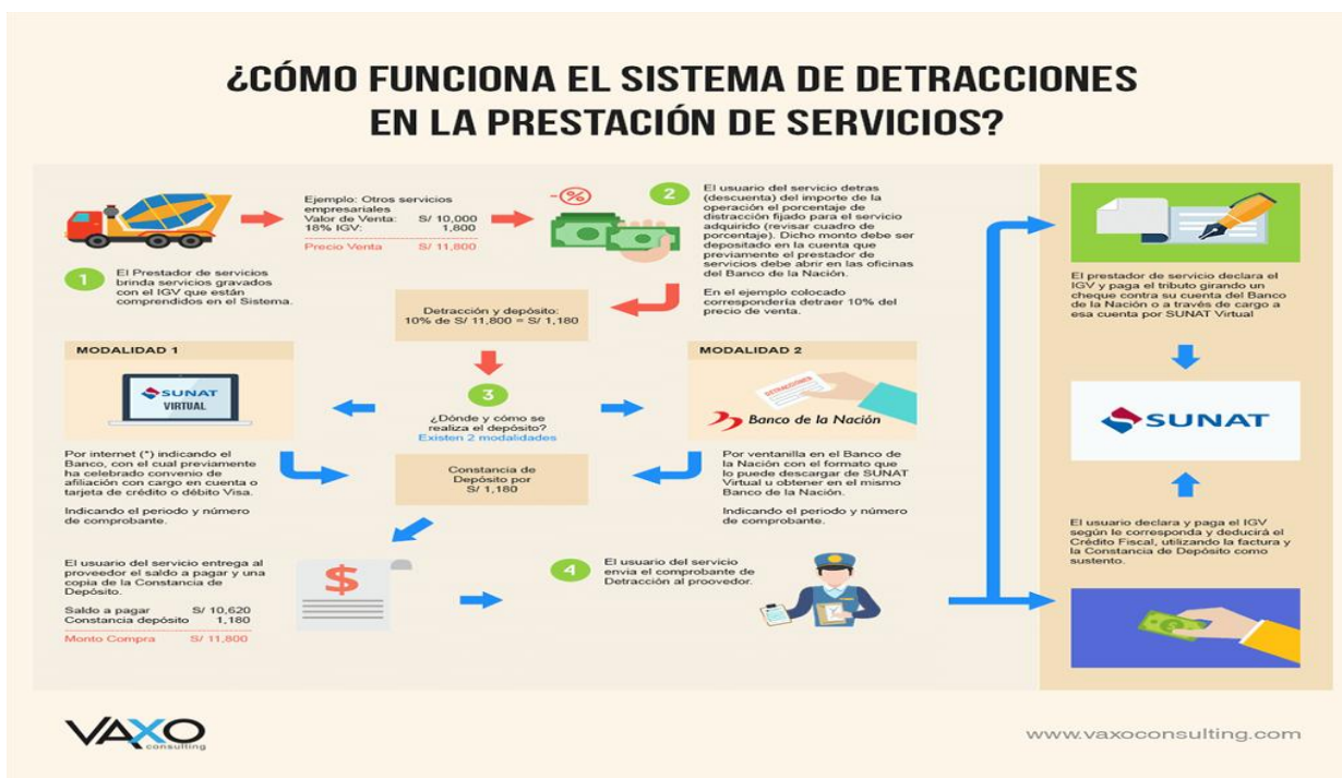
Figura 1. Prestación de Servicio. Tomado del blog VAXO Consulting: Sistema de Pago de Detracción (SPOT). Recuperado de https://vaxoconsulting.com/tributario/sistema-del-pago-detracciones-spot/